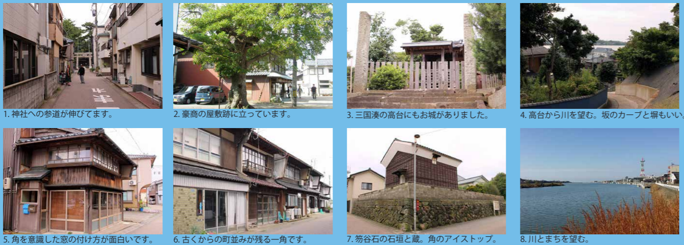
1. 神社への参道が伸びています。 2. 豪商の屋敷跡に立っています。 3. 三国湊の高台にもお城がありました。 4. 高台から川を望む。坂のカーブと塀もいい。 5. 角を意識した窓の付け方が面白いです。 6. 古くからの町並みが残る一角です。 7. 笏谷石の石垣と蔵。角のアイストップ。 8. 川とまちを望む。