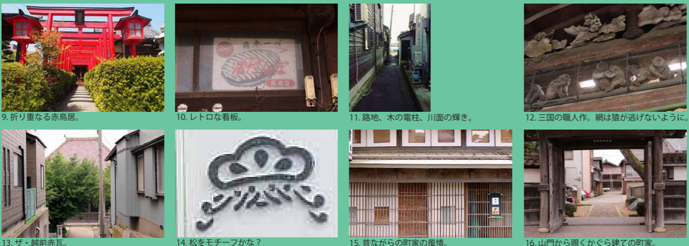
9. 折り重なる赤鳥居。 10. レトロな看板。 11. 路地、木の電柱、川面の輝き。 12. 三国の職人作。網は猿が逃げないように。 13. ザ・越前赤瓦。 14. 松をモチーフかな？ 15. 昔ながらの町家の風情。 16. 山門から覗くかぐら建ての町家。