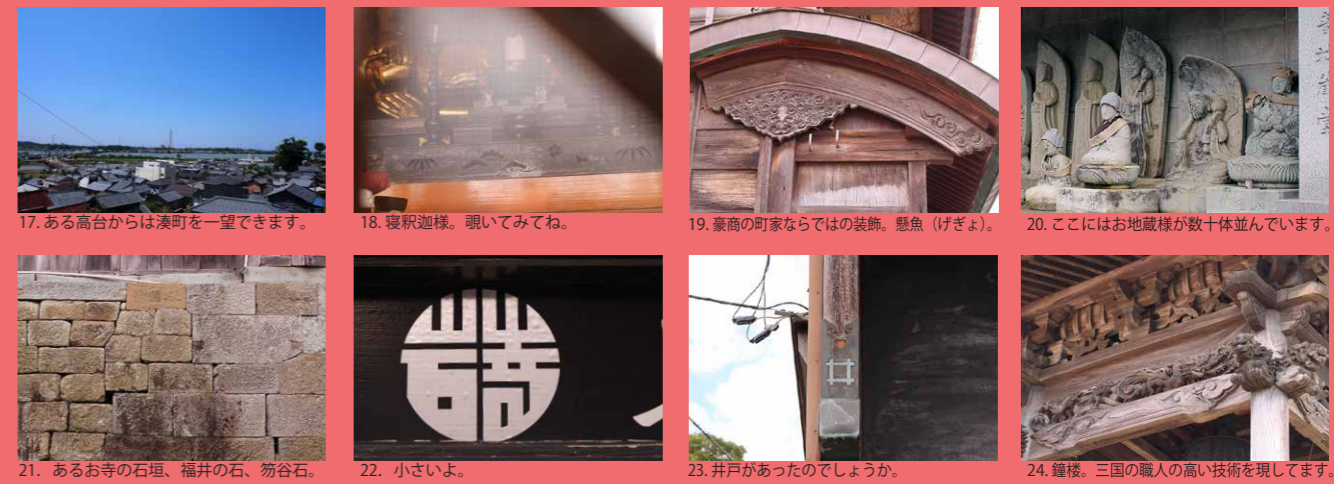
17. ある高台からは湊町を一望できます。 18. 寝釈迦様。覗いてみてね。 19. 豪商の町家ならではの装飾。懸魚(げぎょ)。 20. ここにはお地藏様が数十体並んでいます。 21. あるお寺の石垣、福井の石、笏谷石。 22. 小さいよ。 23. 井戸があったのでしょうか。 24. 鐘楼。三国の職人の高い技術を現しています。