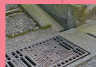
6. 側溝の蓋が龍翔館、よく探してね。