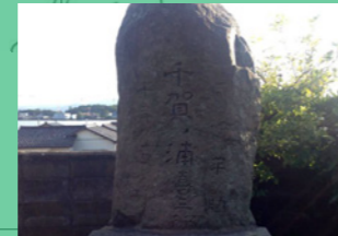
3. 三国出身のお相撲さんがいたんだって