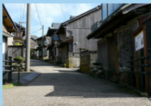
6. 見返り橋から続く風情ある坂道。