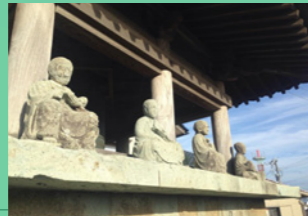
2. 少し高いところに並んでいます。