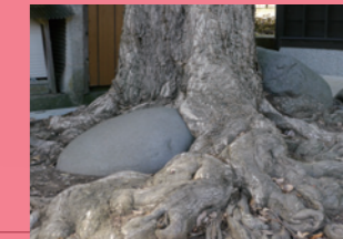
4. 石が木に食べられてしまう〜。