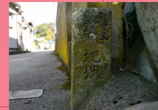
2. どこかの曲がり角にありますよ〜