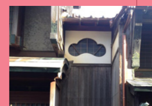
7. 家と家を繋ぐ通路かな？