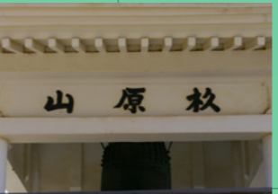
4. なんて読むんだろう、、、。