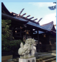
1. 大砲みたいな突起物が面白い。