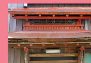
4. 立派過ぎる勝手口。