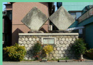
6. 近づいてみると、とても大きいよ。