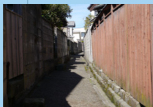
3. 細〜い路地、どこへ出るかな。