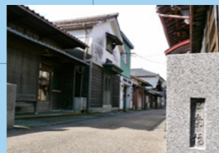
8. 長崎にもあるよ、思案橋。