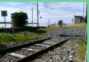
8. ここから、勝山まで線路が続いています