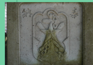
7. デザインが湊町の証、灯笼です。