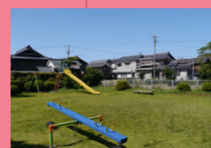
5. 細い路地を進むと、あっ！公園だ。