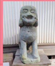
1. ダースベイダーのネタ元は、この狛犬だった!!