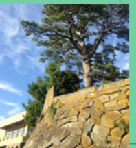
1. 町中の松の木の中では一番ノッポ。