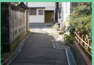
5. 道幅が三段階に変わる路地です。