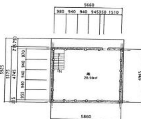
2階平面図 1/100 28.98㎡